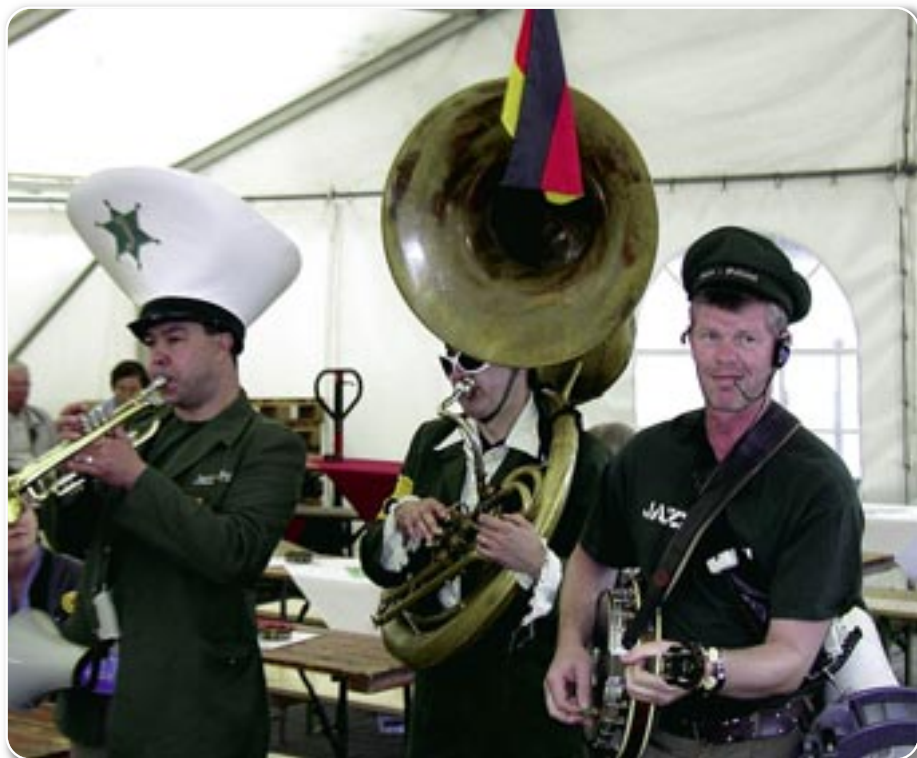
Mit musikalischem Humor begeisterte die Jazzpolizei Berlin.