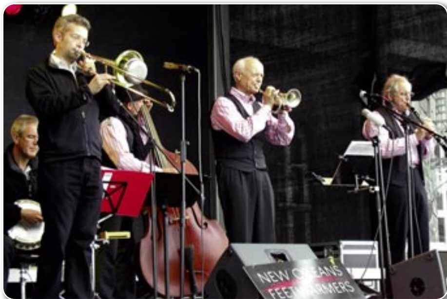
Da blieb kein Fuß still: Die New Orleans Feetwarmers machten ihrem Namen alle Ehre

Boogie Woogie Express – das breit angelegte Musikprogramm zum Jubiläumsfestival ließ keine Wünsche offen. Ganz ohne Strafzettel, dafür aber mit einer gehörigen Portion musikalischem Witz sorgte zwischen durch die „Jazzpolizei“ aus Berlin für klangvolle Ordnung.